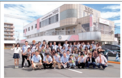
NDS 苫小牧中野自動車学校