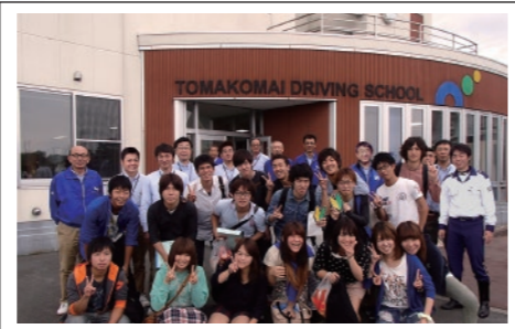
ToDS 苫小牧ドライビングスクール